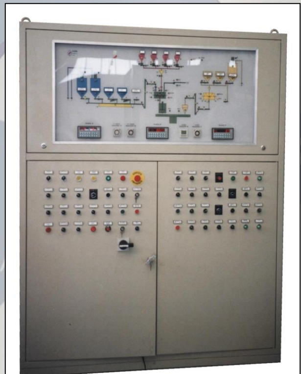
Q.E. con sinottico e comandi manuali da selettore. Electric board with synoptic and manual controls from the selector.