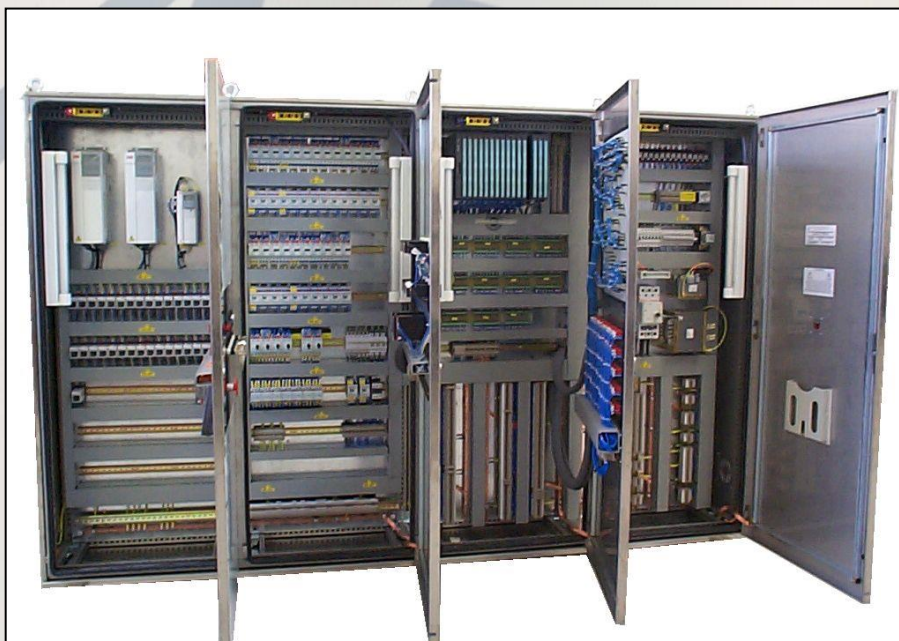
Q.E. in Inox sinottico e sistema di supervisione CAMImpianti da PC. Electric board in synoptic stainless steel and CAMImpianti checking system from PC.