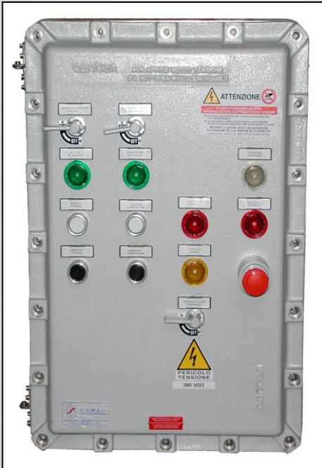
Q.E. antideflagrante. Explosionproof electric board