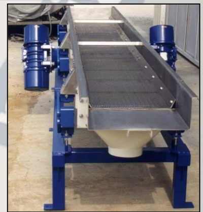
Canale vibrante (CV). Vibrating conveyor (VC).