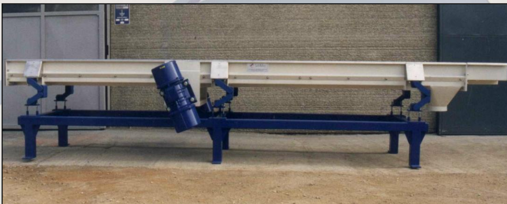
Canale vibrante (CV). Vibrating conveyor (VC).